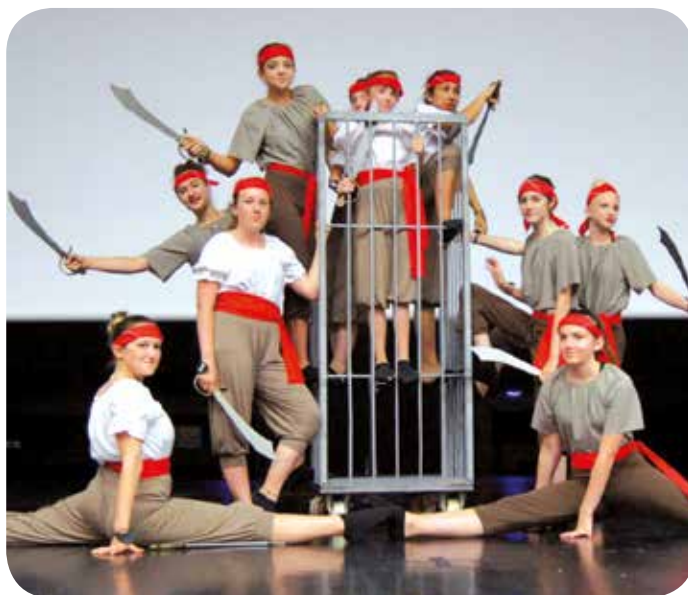
Gala de danse.