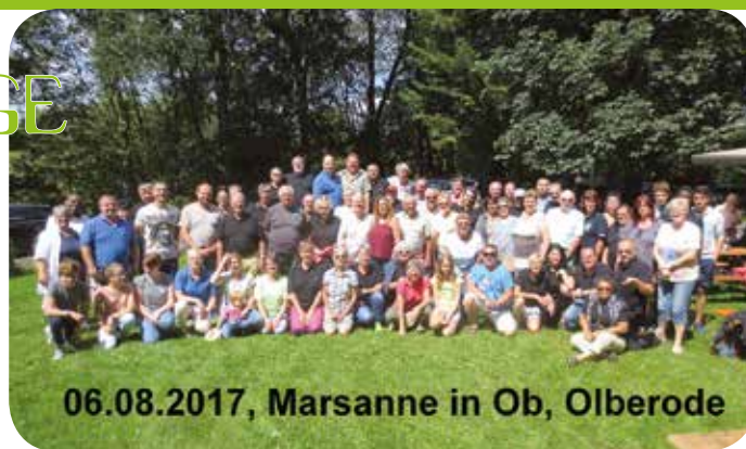
06.08.2017, Marsanne in Ob, Olberode

Le séjour était aussi l'occasion d'entamer la préparation de notre visite 2018 pour les 1150 ans d'Oberaula du 25 juin au 1 er juillet. C'est leur traditionnel marché de l'été (Sommermarkt), pour l'occasion en costumes historiques, qui clôtura