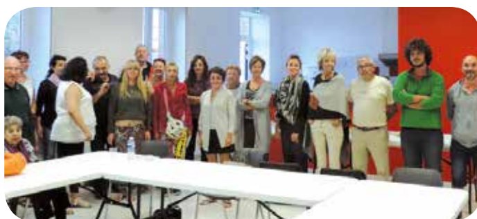
Repas de début de saison avec les animateurs.