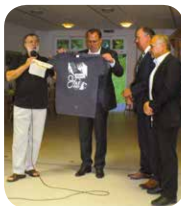
Remise T-Shirt Street Golf.