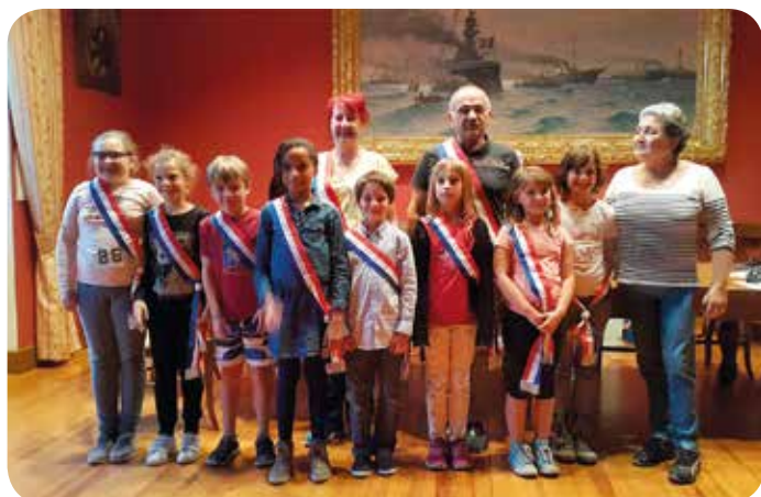
Premier conseil des CMJ.

Après cet exposé qui a retenu toute l'attention de l'auditoire, chacun a exprimé ses idées sur les dysfonctionnements et les améliorations à apporter au sein du village, ainsi que les souhaits de réalisation émis par leurs petits camarades dont ils sont les représentants.