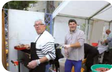
1 er mai