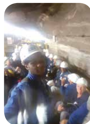
Mine de Merkers.

cette semaine des festivités. Durant cette semaine il y aura une journée consacrée à notre jumelage. Depuis septembre notre association fait partie de l'AFAPE (Acteurs franco-allemand pour la paix en Europe). Cela nous permettra d'avoir des conférenciers pour nos conférences.