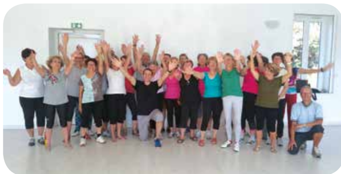
Des cours de gym.