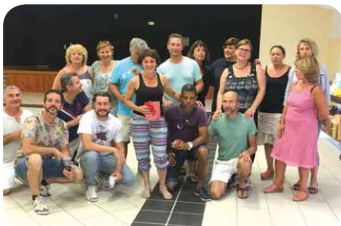
Cours de salsa.